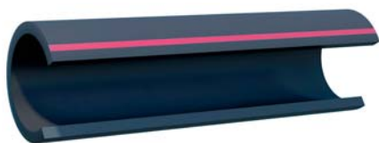
Однослойная труба ELECTROSAFE