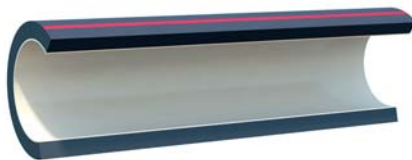
Двухслойная труба с внутренним слоем, не поддерживающим горение ELECTROSAFE ML II (ПВ-0)