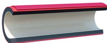
Трехслойная труба с защитной оболочкой ELECTROSAFE ML III (ПВ-0) PS