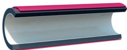
Двухслойная труба с защитной оболочкой ELECTROSAFE ML II (ПВ-0) PS