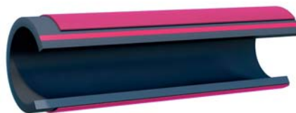
Однослойная труба с защитной оболочкой ELECTROSAFE PS