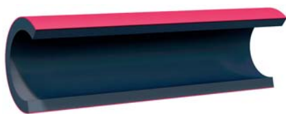
Двухслойная труба с наружным маркерным слоем ELECTROSAFE ML II