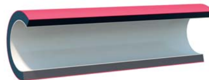
Трехслойная труба с наружным маркерным и внутренним слоем, не поддерживающим горение ELECTROSAFE ML III (ПВ-0)