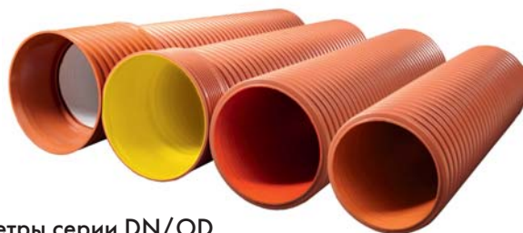
Номинальные диаметры серии DN/OD